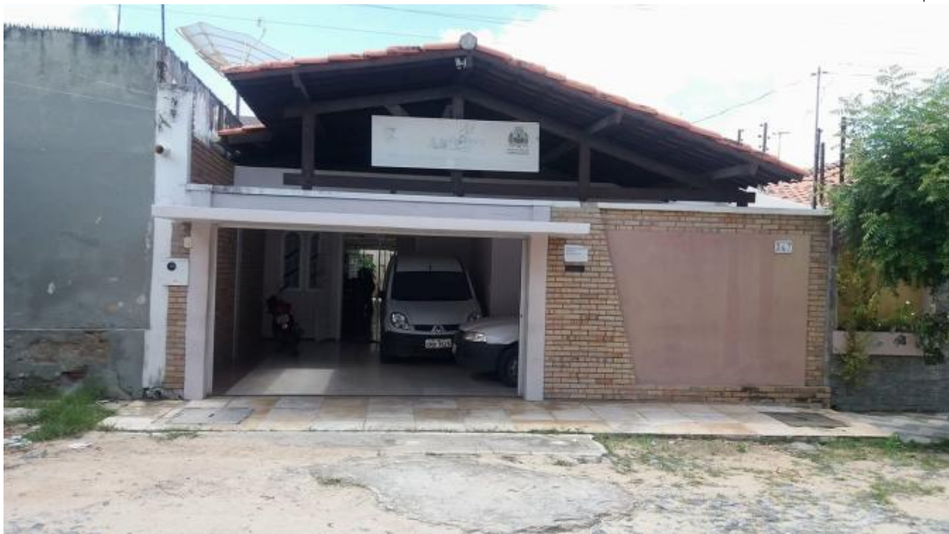
IMAGEM 2 SOBRAL - Placa entre as ruas Dr. Raimundo Lima Neto (CEP 32030 501) e Av. Arlindo Vieira de Almeida ( CEP 62030 490).